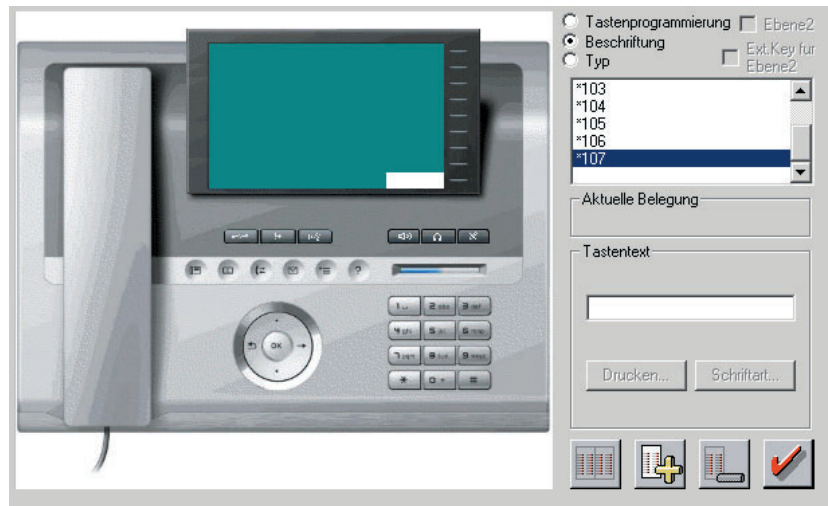
Tastenprogrammierung am OpenStage 80

Wahl- und Zeitpläne ändern, um günstige Call by Call-Anbieter nutzen zu können.