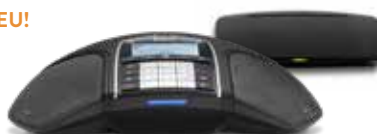
KONFTEL 300Wx IP

Konftel 300Wx in Kombination mit Konftel IP DECT 10 gehört zu einer unserer beliebtesten Lösungen. Nun ist dieses Konferenztelefon auch als Bundle erhältlich. Es ermöglicht schnurlose Telefonkonferenzen in HD-Qualität für Ihre IP-Telefonie (SIP). Auf jeder IP DECT-Basisstation können bis zu 20 Konftel 300Wx-Einheiten registriert werden und fünf Gespräche gleichzeitig stattfinden.