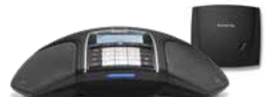
KONFTEL 300Wx ANALOG

Artikelnummer: 951101078 / 854101078 (US)